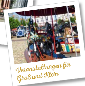
Veranstaltungen für Groß und Klein

Tourist-Information: Alter Markt 18 26441 Jever Tel.: 04461/939-261 www.stadt-jever.de